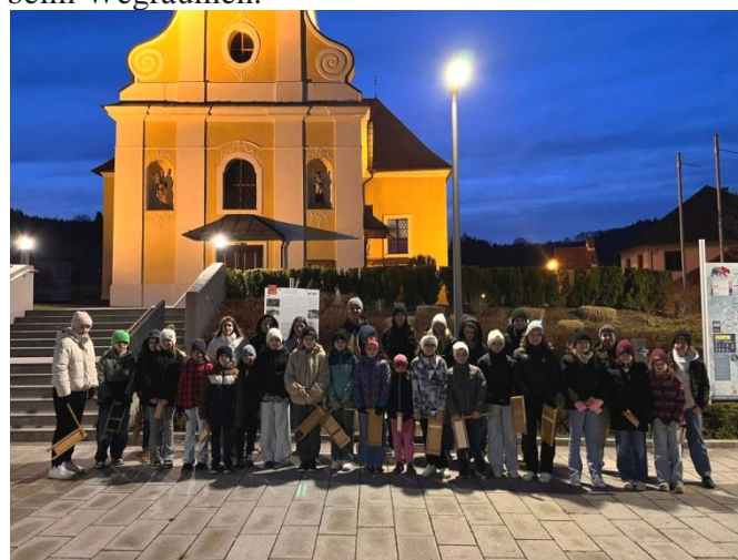
Die fleißigen Ratschenkinder in der Morgendämmerung

Wir bitten um Lospreise und Mehlspeissspenden! Fleißige Männer und Frauen sind gebeten, am Samstag ab 14 Uhr beim Aufbauen der Tische, Bänke und Zelte zu helfen und am Montag ab 9 Uhr beim Wegräumen.