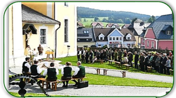
Bei Schönwetter Messe im Freien