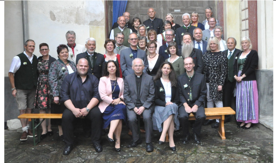
Ehesonntag am 09.06.2024