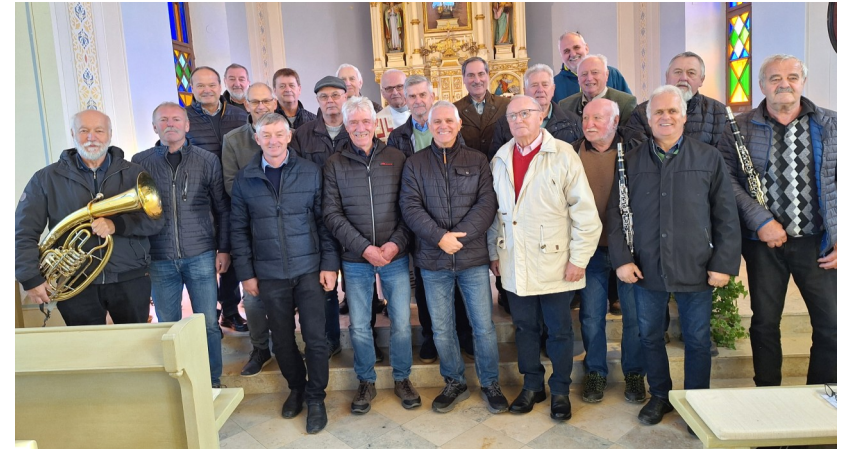
Männerwallfahrt nach Maria Helfbrunn am 16.11. 2024