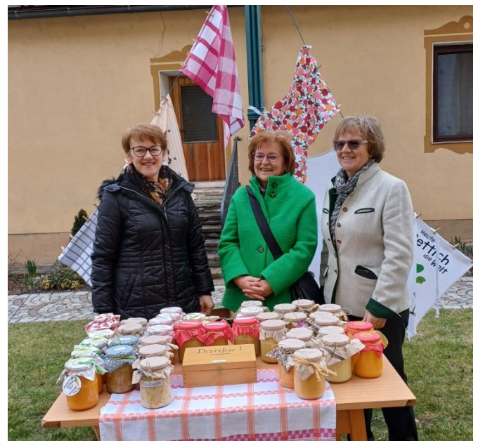
Wie jeden zweiten Fastensonntag fand der Suppensonntag für soziale Zwecke statt. Diesmal für die Frauen in Kolumbien. Danke den Köchinnen und Spenden von 1328 Euro.