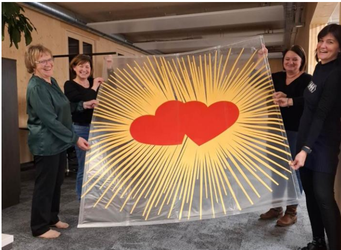
Diesmal fand der Valentinsgottesdienst in Pinggau statt. Die Kirche war erfreulicherweise voll. Danke den Damen vom Pfarrgemeinderat für die tolle Kirchendekoration!