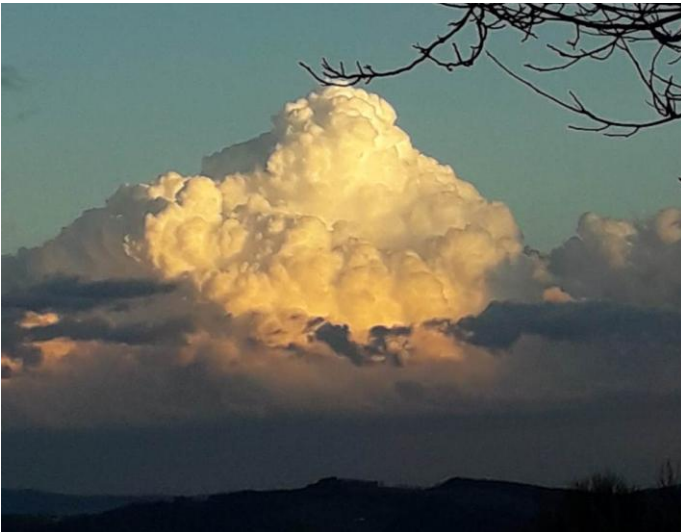
Eine besondere Wolkenstimmung in Rosenbichl.