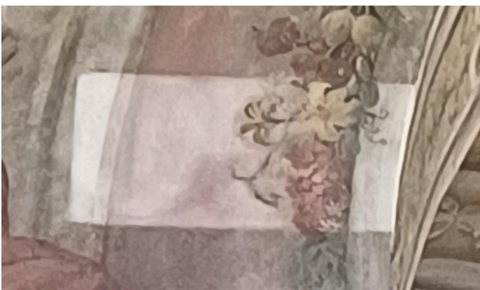
Hier sieht man, wie nach einer nur provisorischen Reinigung die Fresken verschmutzt sind. Im Altarraum wurden sie letztes Mal Mitte der 1960er Jahr restauriert.

Spendenkonto: Raiba Pinggau, Pfarre Pinggau AT09 3802 3000 0151 2300 „Kirchenrenovierung“ DANKE!